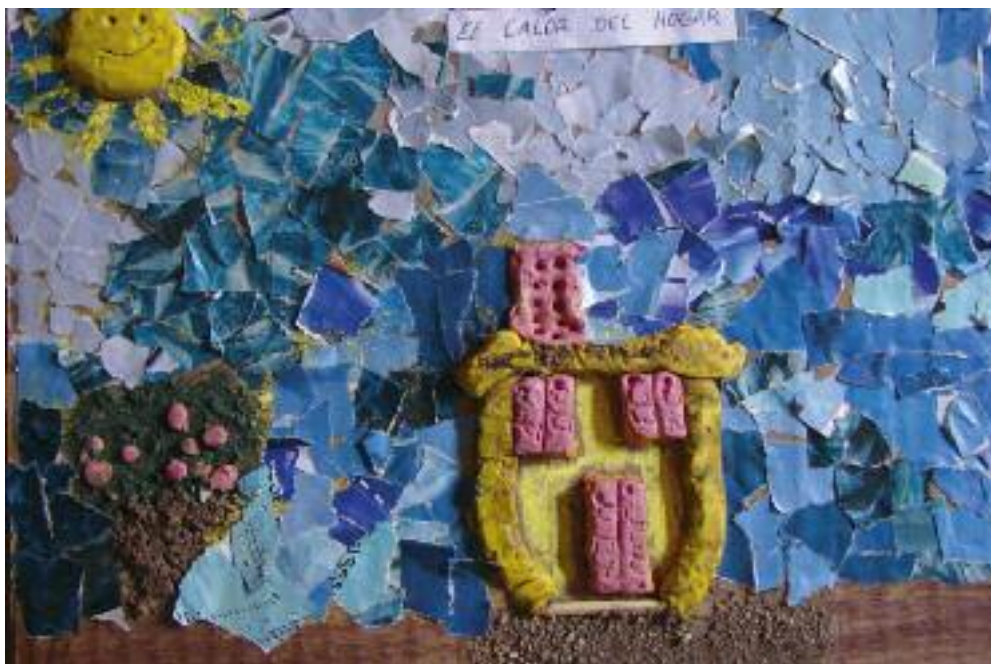
Primer Premio, Categoría A.

Trabajos ganadores del Concurso de Plástica 2010 "ESTO ES NUESTRO"