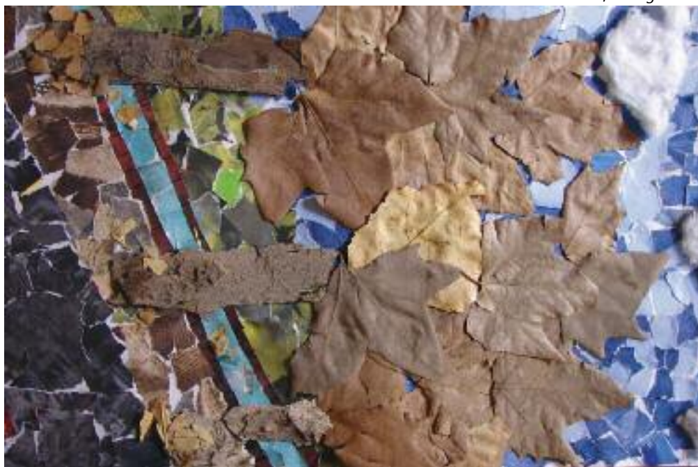
Primer Premio, Categoría B.